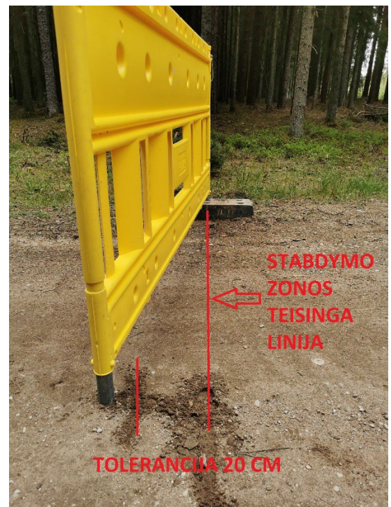
Stabdymo zonos neįveikimas už tolerancijos ribų.