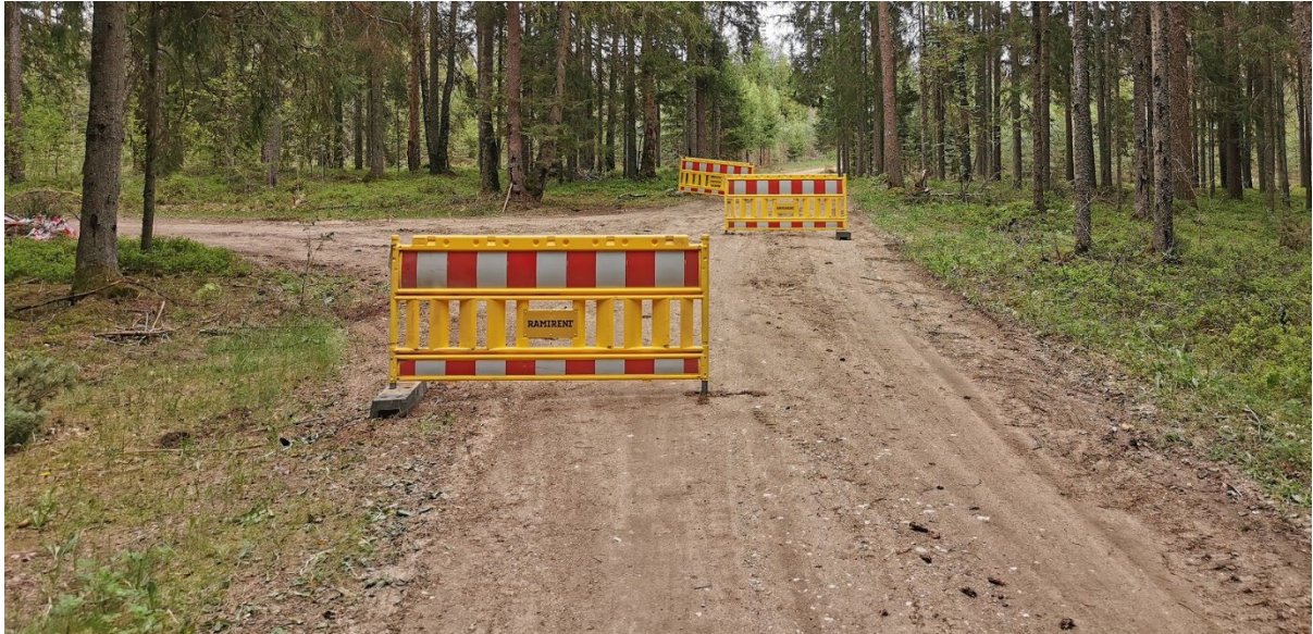
Bendras stabdymo zonos išstatymas, kai naudojamos mobilios plastamasis tvorelės