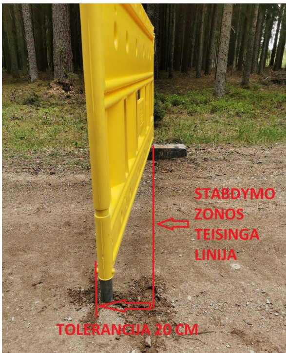
Stabdymo zonos neįveikimas tolerancijos ribose.

4.2. Rekomenduojama stabdymo zonoje įrengti mobilias vaizdo stebėjimo kameras arba naudoti automobilinius registratorius.